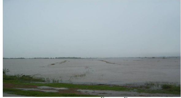
เปรียบเทียบพื้นที่แก้มลิงบางบาลบริเวณโรงสูบน้ำที่ 3 ก่อนและหลังรับน้ำเข้าพื้นที่