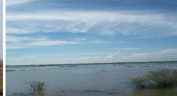
เปรียบเทียบพื้นที่แก้มลิงบางบาลบริเวณโรงสูบน้ำที่ 4 ก่อนและหลังรับน้ำเข้าพื้นที่