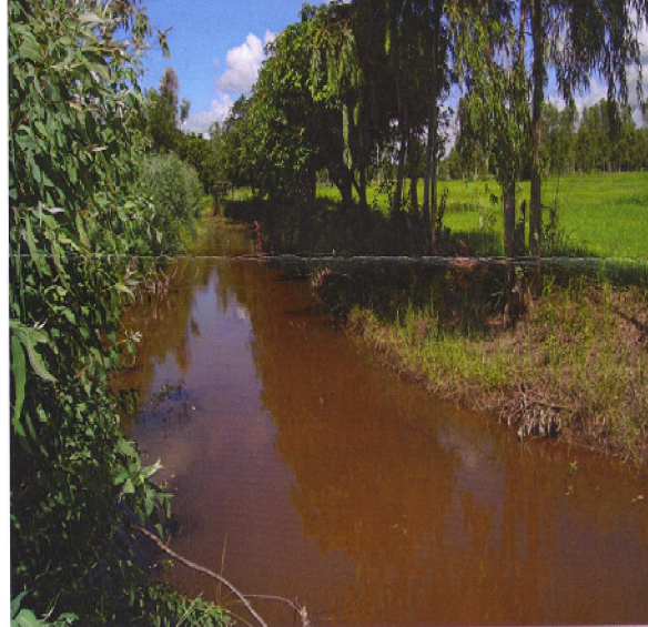
สภาพพื้นที่บริเวณที่จะดำเนินการก่อสร้างคลองส่งน้ำฝายห้วยคต พร้อมขุดลอกลำห้วย