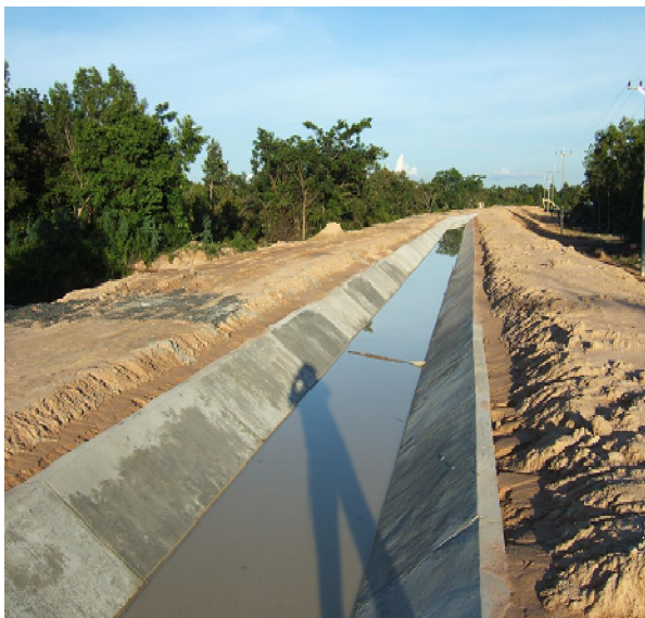
คลองส่งน้ำดาดคอนกรีตที่ดำเนินการแล้วเสร็จบางส่วน

สามารถส่งน้ำสนับสนุนพื้นที่ทำการเกษตร 3,000 ไร่ ให้แก่ราษฎร 3 ตำบล 5 หมู่บ้าน ได้แก่ บ้านบะฮี หมู่ที่ 6 บ้านหมากเฒ่า หมู่ที่ 8 บ้านกกเค็ง หมู่ที่ 13 ตำบลเบิด บ้านยางเตี้ย หมู่ที่ 6 ตำบลยางสว่าง และบ้านหนองแคน หมู่ที่ 7 ตำบลธาตุ อำเภอรัตนบุรี จังหวัดสุรินทร์ 372 ครัวเรือน 1,220 คน มีน้ำใช้สำหรับทำการเกษตรและอุปโภค-บริโภคอย่างเพียงพอตลอดปี และเป็นแหล่งน้ำเสริมสำหรับปลูกพืชไร่ และพืชผักสวนครัว ส่งเสริมให้ราษฎรในพื้นที่สามารถทำการเกษตรได้อย่างต่อเนื่อง