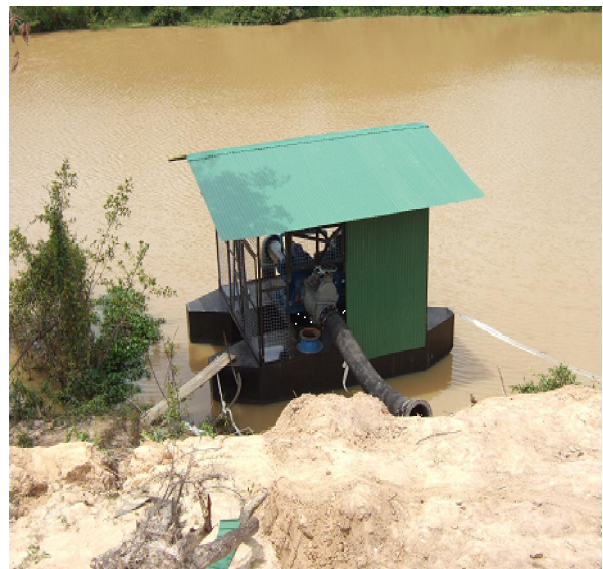
เครื่องสูบน้ำที่ดำเนินการติดตั้งแล้วเสร็จ