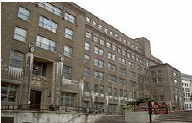
ภาพด้านเหนือของตึก Guildhall ซึ่งเป็นที่ตั้งของสำนักงานส่วนใหญ่ของ City of London

Corporation of London หรือ City of London นี้ เป็นองค์กรปกครองส่วนท้องถิ่น (local authority) ที่เก่าแก่ที่สุดของอังกฤษ ก่อตั้งมาตั้งแต่สมัยกลาง (medieval times) โดยนำรูปแบบของฝรั่งเศสมาใช้ มี maire ('mayor') เป็นหัวหน้า และมีสภา Court of Common Council ซึ่งเป็นโครงสร้างที่มีมาก่อนรัฐสภาของประเทศอังกฤษเสียอีก เนื่องจากมีพัฒนาการต่อเนื่องมานานนับร้อยนับพันปี จึงทำให้เป็นชุมชนและองค์กรที่เข้มแข็ง มีความโดดเด่น ไม่เหมือนใคร