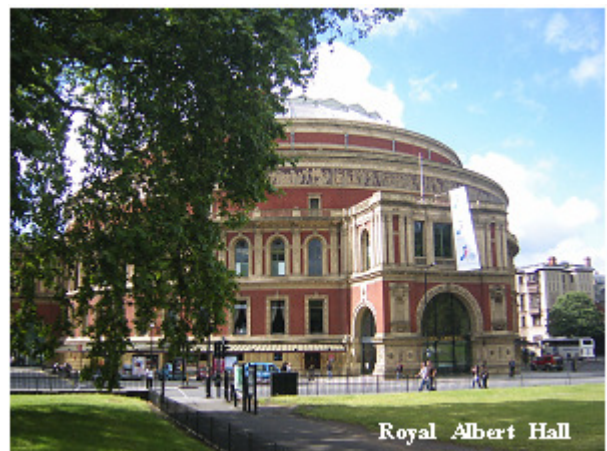
Royal Albert Hall

นอกจากบทบาทหน้าที่ในทำนองเดียวกับองค์กรปกครองส่วนท้องถิ่นทั่วไป เช่น การเคหะ การจัดเก็บขยะ การจัดการศึกษา บริการสังคม อนามัยสิ่งแวดล้อม และการผังเมืองแล้ว City of London ยังทำบทบาทหน้าที่พิเศษบางอย่างด้วย เช่น มีตำรวจของตนเอง ดูแลศาลอาญา (Central Criminal Court) หรือ the Old Bailey การสร้างและดูแลสะพานข้ามแม่น้ำเทม 5 แห่ง บริหารจัดการสถานีตรวจกักกันโรคพิษและสัตว์ (quarantine station) ที่สนามบิน Heathrow บริหารจัดการ the Port Health Authority รวมทั้ง บริหารจัดการตลาดขายส่งสินค้าบริโภคสำคัญ 3 แห่ง (คือ Billingsgate, Spitalfields and Smithfield) ซึ่งส่งอาหารสดไปเลี้ยงดูประชาชนในกรุงลอนดอนและบริเวณตะวันตกเฉียงใต้