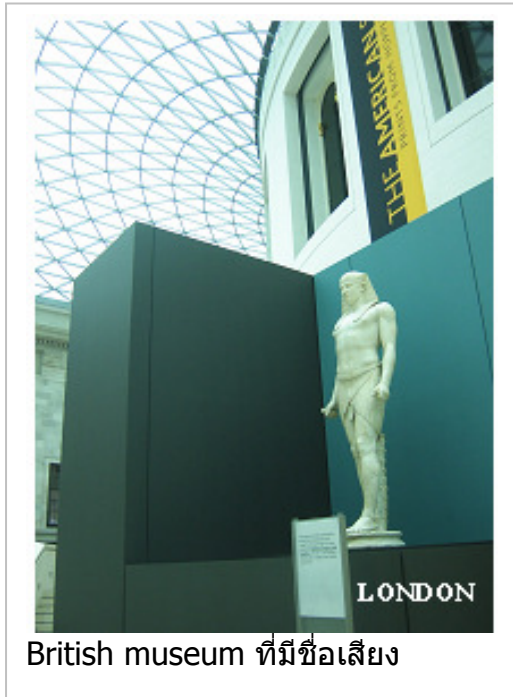
British museum ที่มีชื่อเสียง

หากแต่ได้ทำหน้าที่เอื้ออำนวยบริการ ข้ามออกไปนอกเขตพื้นที่ด้วย นับตั้งแต่พื้นที่ซึ่งมีประชาชนเบาบาง เช่นการดูแลป่า Epping Forest ไปจนถึงการดูแลศูนย์สุขภาพ Hampstead Heath และศูนย์ศิลปะ Barbican Arts Centre ที่มีชื่อเสียง เป็นต้น