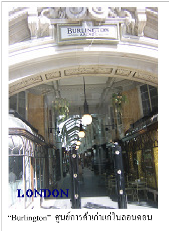
“Burlington” ศูนย์การค้าเก่าแก่ในลอนดอน

นายกเทศมนตรีนครลอนดอนทำบทบาทด้านธุรกิจอย่างกว้างขวางเพื่อประเทศอังกฤษโดยรวม โดยปฏิบัติงานทั้งในและต่างประเทศ เพื่อสนับสนุนและส่งเสริมบทบาทการเป็นศูนย์กลางการเงินการคลังระดับโลกของ City of London