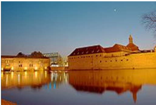
ENA ที่ Strasbourg, France

หลักสูตรด้านการบริหาร 6.5 เดือน เป็นหลักสูตรเร่งรัด สำหรับเจ้าหน้าที่รัฐในตำแหน่งระดับสูงของประเทศต่างๆ เนื้อหาเน้นความรู้ใน 3 ด้าน คือ การบริหารและระบบ (Administration and Institutions), การทูตและความสัมพันธ์ระหว่างประเทศ, เศรษฐกิจและการคลังสาธารณะ